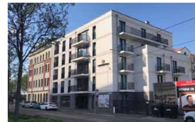
Beispiele durch die IKS Immobiliengruppe realisierter Projekte. Hänicher Mühle 12 in Lützscha (links), Eutritzscher Markt 7 in Leipzig (rechts oben), Kohlgartenstraße 3 in Leipzig (rechts unten)

Der Prozess der Bauausführung wird bei allen unseren Projekten stets mit dem Kunden abgestimmt. Unsere Zielsetzung ist: nachhaltiges Bauen in hoher Qualität, termingerechtheit und mit Preissicherheit. Daher belassen wir es nicht allein beim Bauen einer Wunschimmobilie. Der Service davor und danach gehört dazu. Wir unterstützen deshalb auch bei der Finanzierung, bei der Suche nach geeigneten Mietern/Käufern oder einer professionellen Hausverwaltung.