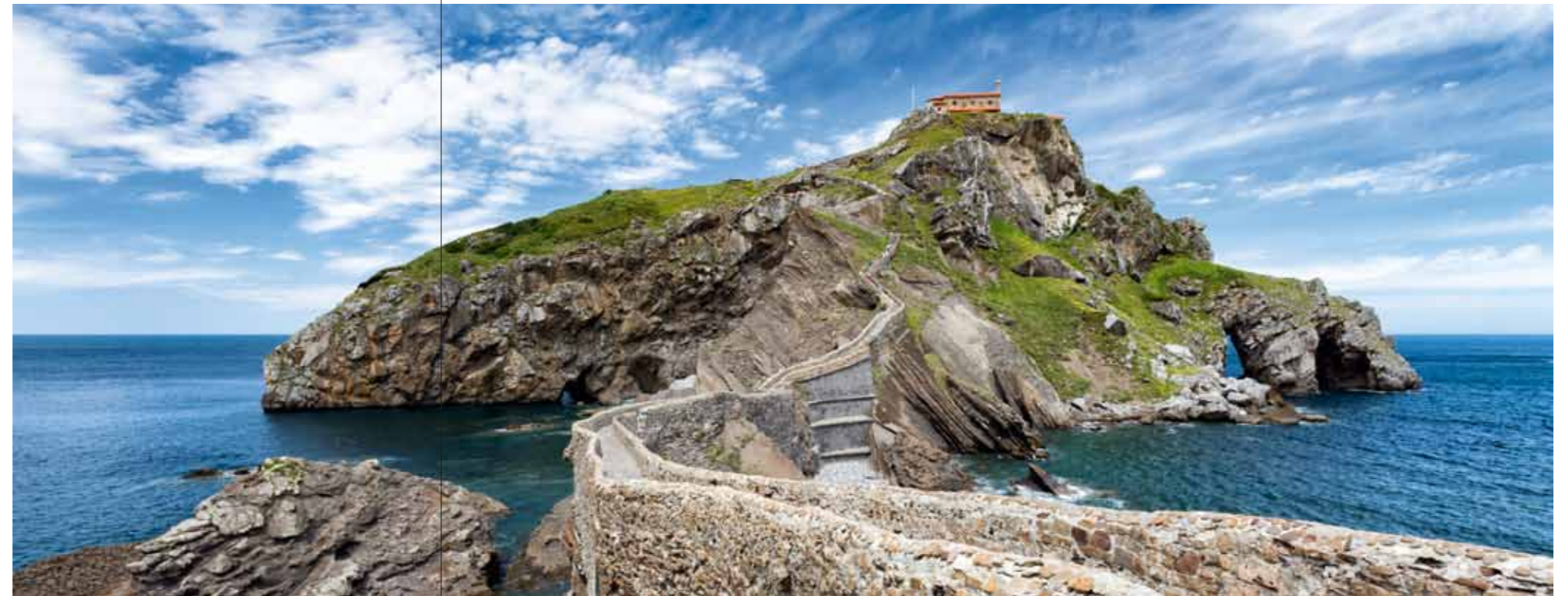
Segeltour 2018 – vorbei an traumhafter Kulisse